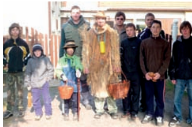
Před jidášskou obchůzkou