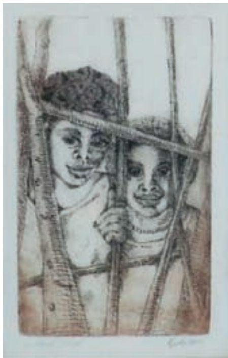
Těším se na vás Melvys

Budou tam k vidění mé grafiky (lepty, rytiny, linoryt...), dále soubor olejových obrazů "Tajuplná příroda" a do třetice sada maleb zátiší. Budete moci navštívit saloněk, kde naleznete mou současnou tvorbu v podobě hraček, šperků, malby na textil, na hedvábí,...V případě zájmu si budete moci vystavené výtvoř zakoupit. Pokud přijдете, setkáme se osobně během mého tvoření v příjemném nekuřáckém prostředí.