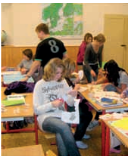
práce při hodinách chemie