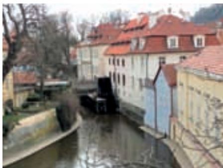
Zvláštní ocenění: Michaela Švachová, 11 let

Tímto vyhlášíme další kolo této fotografické soutěže, kterého se mohou zúčastnit žáci základních nebo středních škol, a to ve třech kategoriích: 1. - 5. třída ZŠ., 6. - 9. třída ZŠ a věková kategorie 15 - 18 let. Nejlepší fotografie budou poslány do národního kola a oceněny hodnotnými věcnými cenami. Uzávěrka letošního ročníku je 16. 11. 2012. Fotografie doručujte na Městský úřad v Luži v elektronické a tištěné verzi (fotografie formát 9x13).