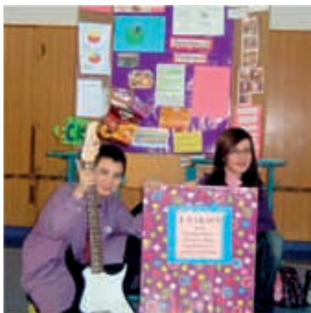
8.A na soutěži