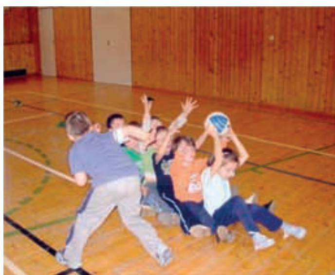
Fotbalová školička v akci.