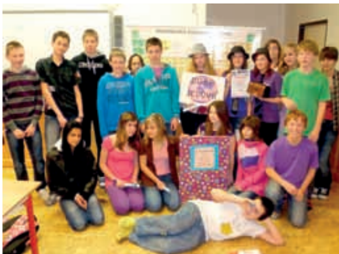
Kolektiv 8.A na soutěži - 3. místo