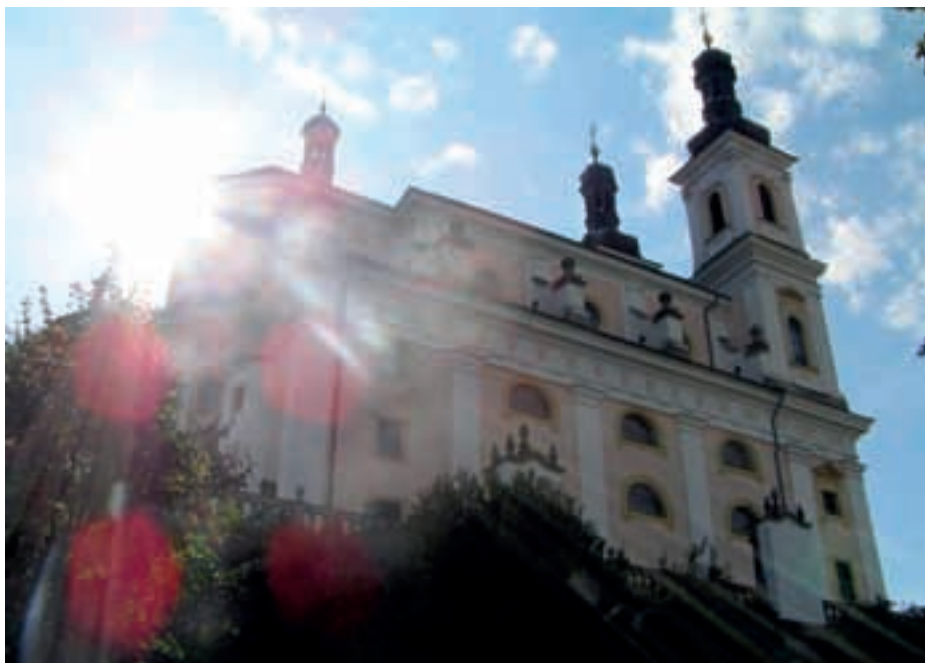
Top fotografie: Klára Doležalová, 11 let

V červnu loňského roku vyhlásilo Město Luže v rámci akce „Dny evropského dědictví“ městské kolo fotografické soutěže, kterého se mohli zúčastnit žáci základních nebo středních škol, a to ve třech kategoriích: 1. - 5. třída ZŠ., 6. - 9. třída ZŠ a věková kategorie 15 - 18 let. Cílem soutěže bylo podnítit zájem mladých lidí o památky zejména v jejich okolí.