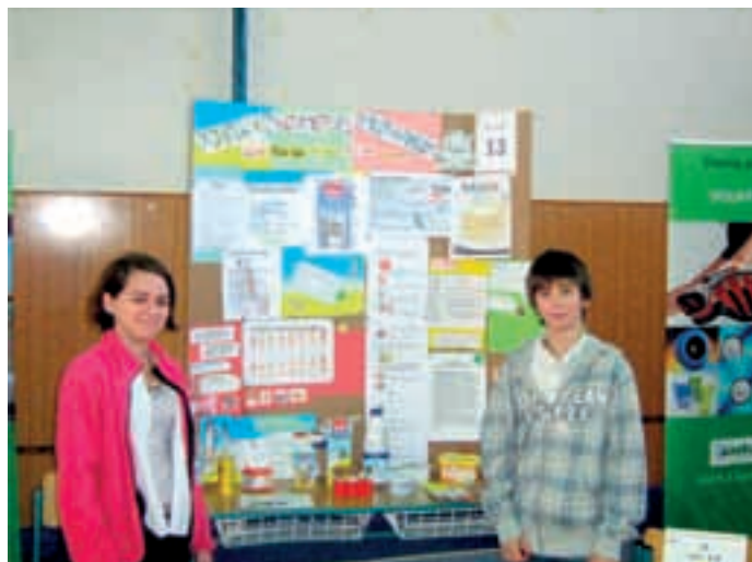
8.B na soutěži