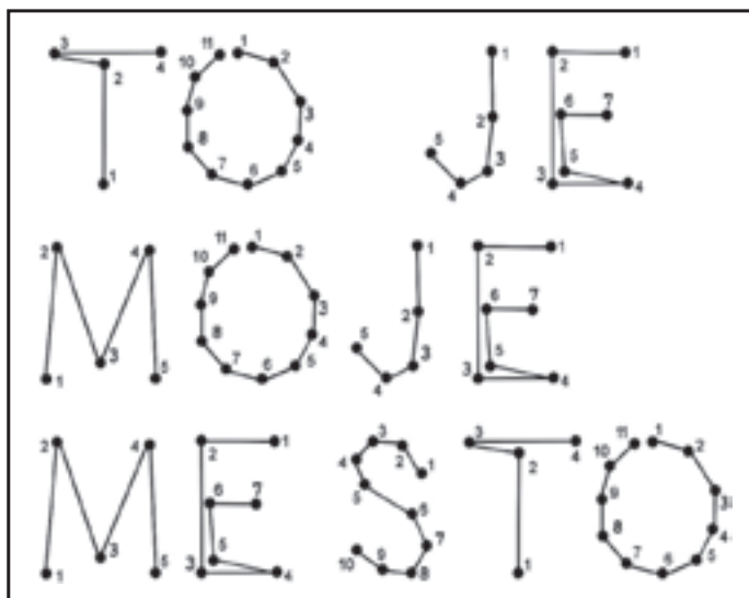
To je moje město - uspořádané

Autorský tým: Michal Kuzemský Jan Vlach Ida Čapounová David Pavlišta Jiří Žid David Kraus Ondřej Synek