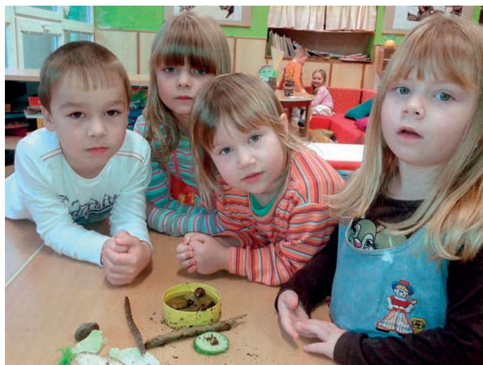
Noví šnečí kamarádi Tykadýlko a Ulička v naší školce.